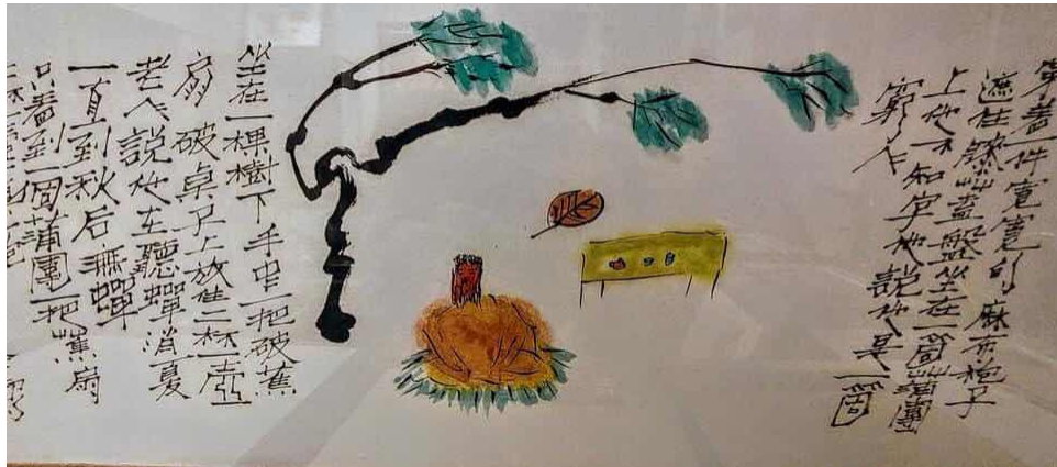
管管畫作《聽蟬》2017.5 夏／向明、孫金君提供

詩人管管紀念輯 散文詩專頁 從艾略特認知的波特來爾想起 e. e. cummings 詩選譯